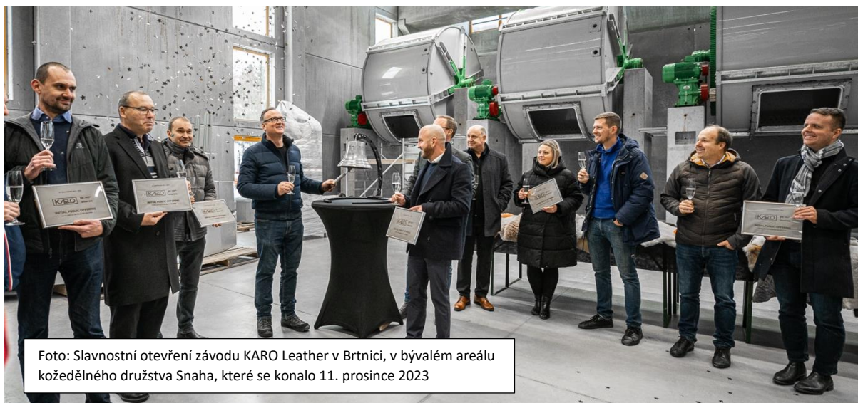
Foto: Slavnostní otevření závodu KARO Leather v Brtnici, v bývalém areálu kožedělného družstva Snaha, které se konalo 11. prosince 2023